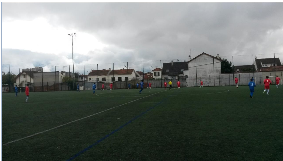
Photo : Match de nos U16, en bleu face à Palaiseau. Score final : 5-0 pour la JAD.

Nos U16, évoluant en championnat régional poule B. Elle devrait confirmer sur la deuxième partie du championnat sa 4 ème place, là aussi, dans un groupe très relevé.