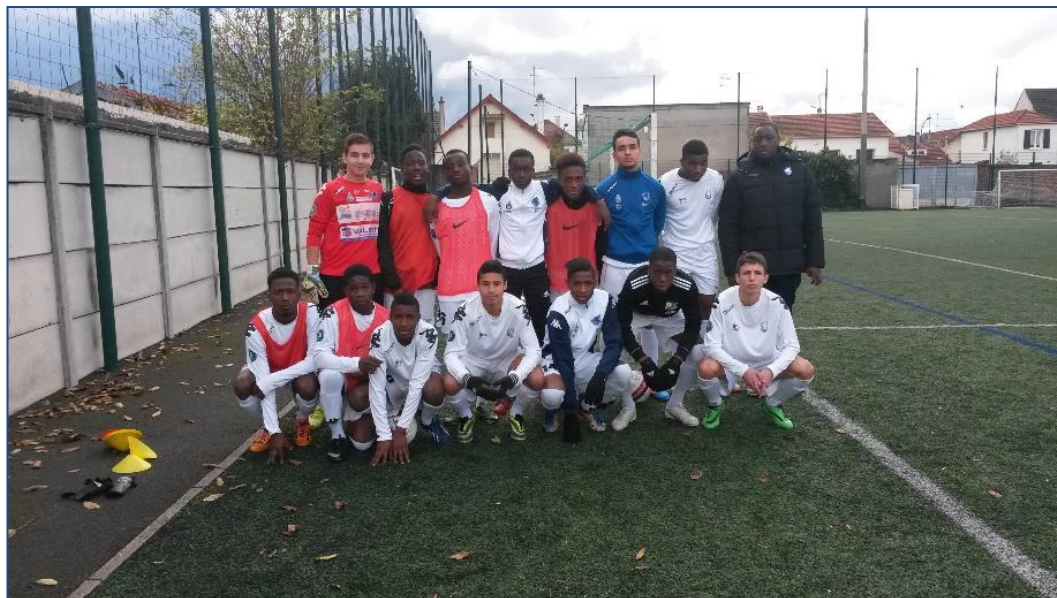
Photo : U17 équipe 2 avec leur coach, au stade Maurice Baquet à Drancy.

Nos U17, équipe 2, évoluant en DHR poule C. Excellent comportement de cette équipe. 3 ème aujourd'hui, elle peut obtenir la seconde place en rivalisant avec le Pays de Fontainebleau. La 1 ère occupée par Argenteuil semble inaccessible.